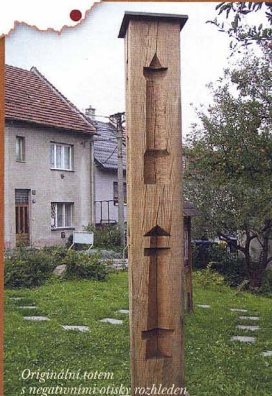
Originální totem s negativními otisky rozhleden