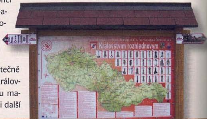
Rozhlednomapa je pro Českou a Slovenskou republiku společná.