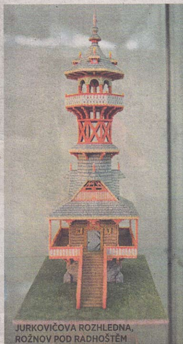
JURKOVIČOVA ROZHLEDNA, ROŽNOV POD RADHOŠTĚM