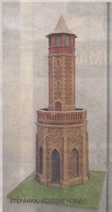
STĚPÁNKA, JIZERSKÉ HORY